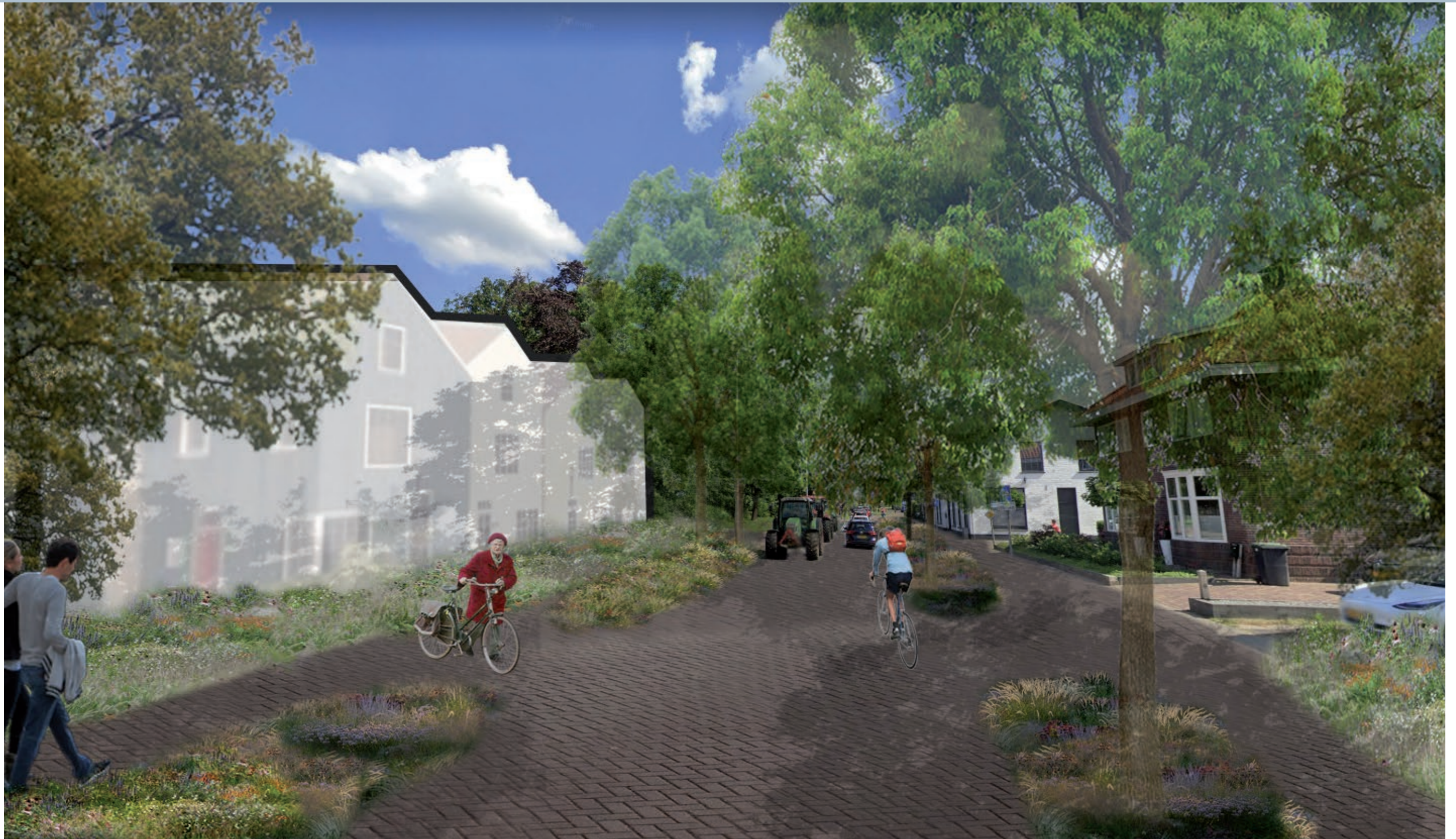
Transformatie Hoofdstraat: Uitplaasten tankstation maakt ruimte voor nieuwe woonfuncties.