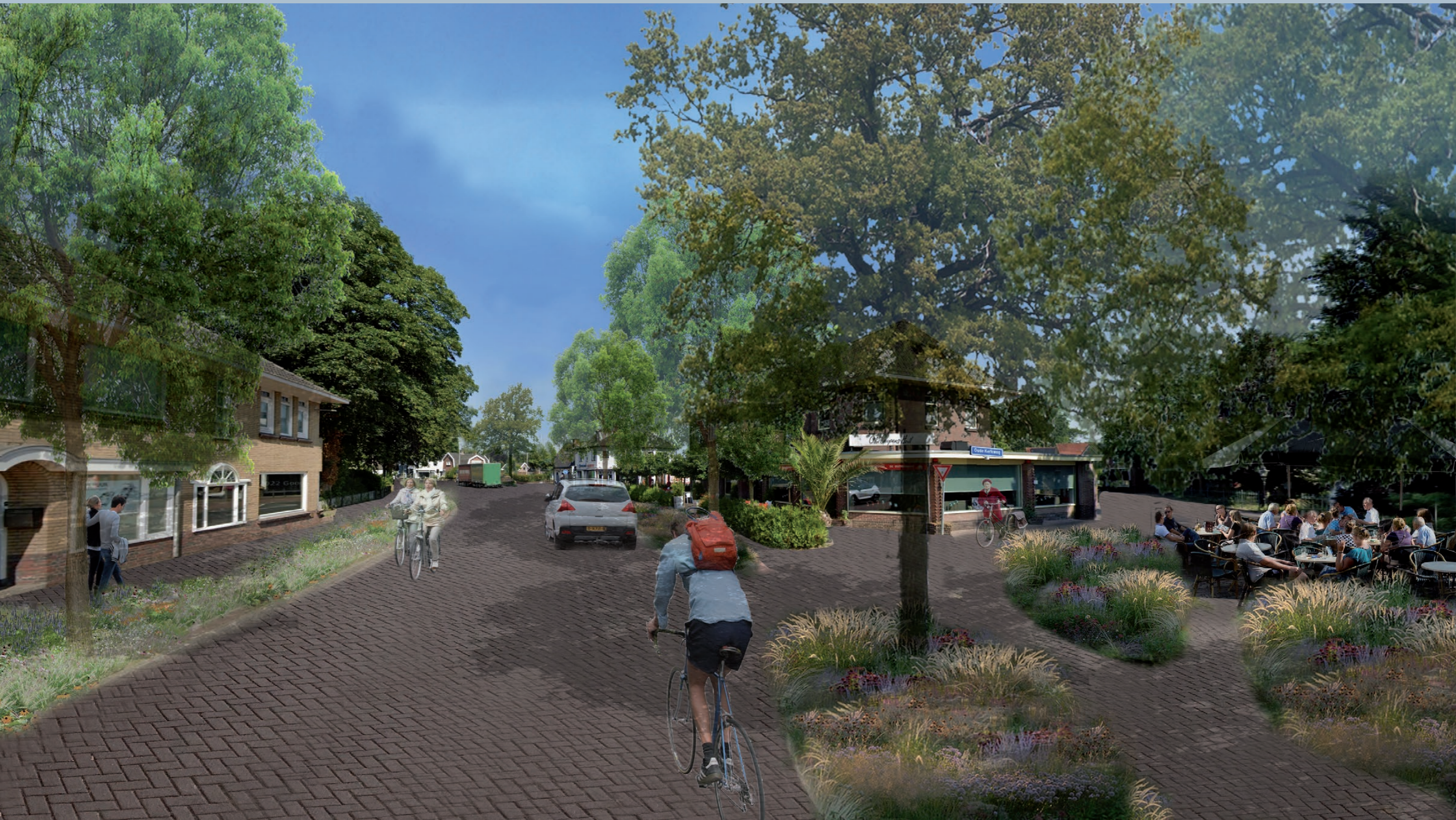
Transformatie Hoofdstraat: Ruimte voor groene klimaatrobuuste openbare ruimte met prettige en knusse verblijfsplekken