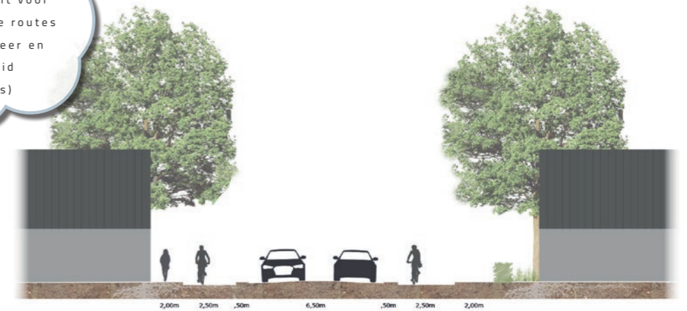
Bestaand principe profiel: Hoofdstraat met bestaande bomen

Niet alleen aandacht voor bestaande en nieuwe routes maar ook voor beheer en toegankelijkheid (o.a. Patersbos)