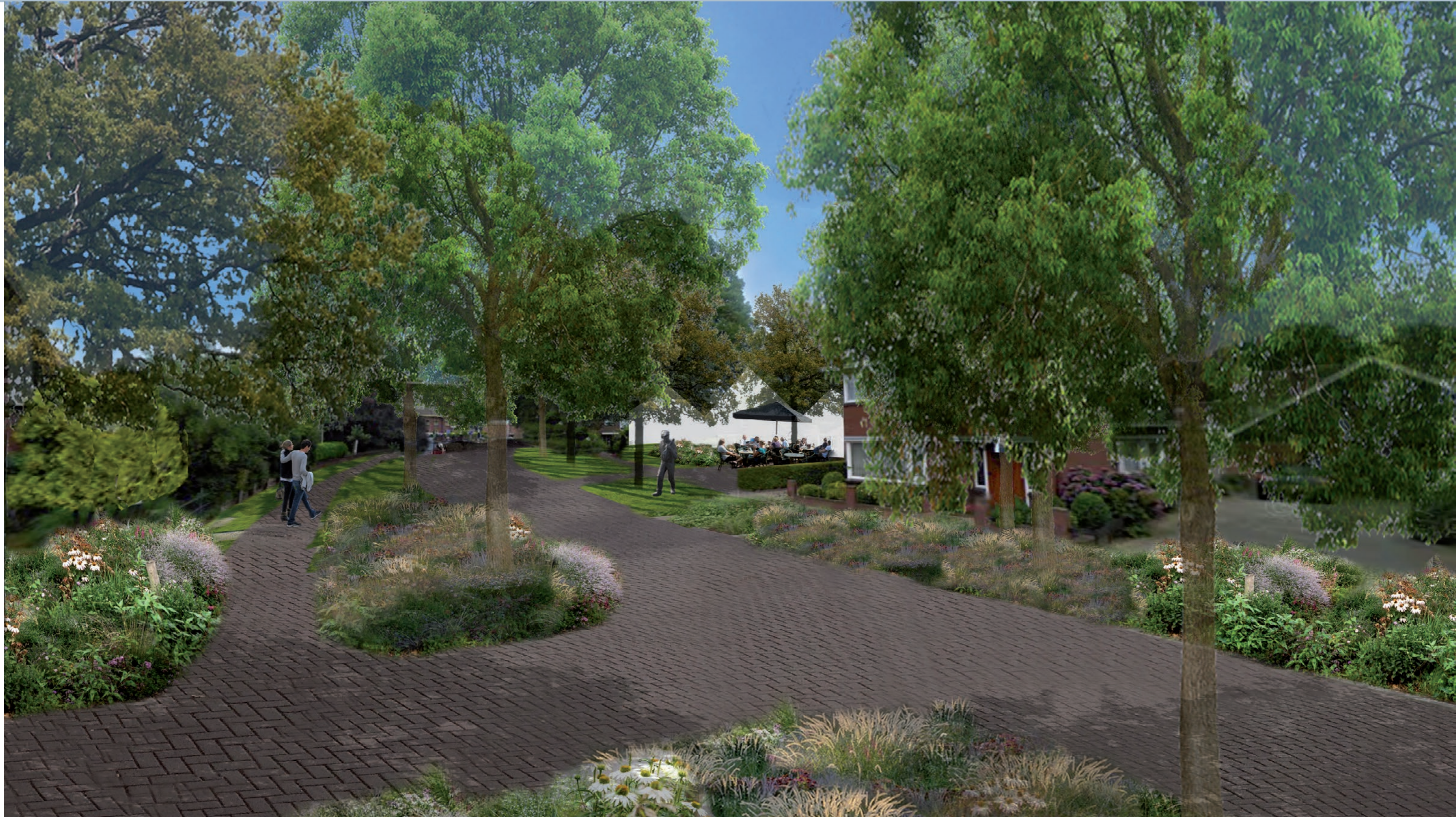
Transformatie Hoofdstraat: Behouden van waardevolle bomen geeft karakter aan de Hoofdstraat met daarin meer ruimte voor de fietsers en voetgangers