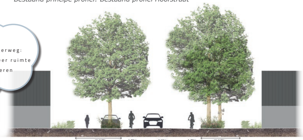
Nieuw principe profiel: Meer ruimte voor fiets- en voetganger. Parkeren tussen robuust groen

Hoofdstraat en Albergerweg: Snelheid afwaarderen meer ruimte voor groen en parkeren