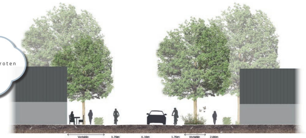
Nieuw principe profiel: Kansen voor vergroening en prettige verblijfsplekken

Hoofdstraat: Verblijfskwaliteit vergroten